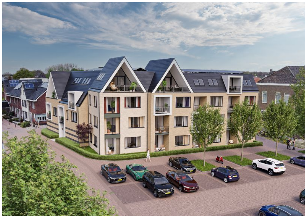
Achter het Vrijthof 5821 BJ Vierlingsbeek type E Vraagprijs: € 295.000,-- v.o.n.