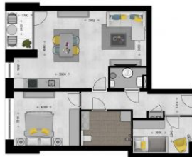
1e Verdieping, Vierlingsbeek - Appartement 5 De plattegrond(en) zijn geschikt voor oriëntatie doeleinden. Er kunnen geen rechten aan ontleend worden. © Topex.nl