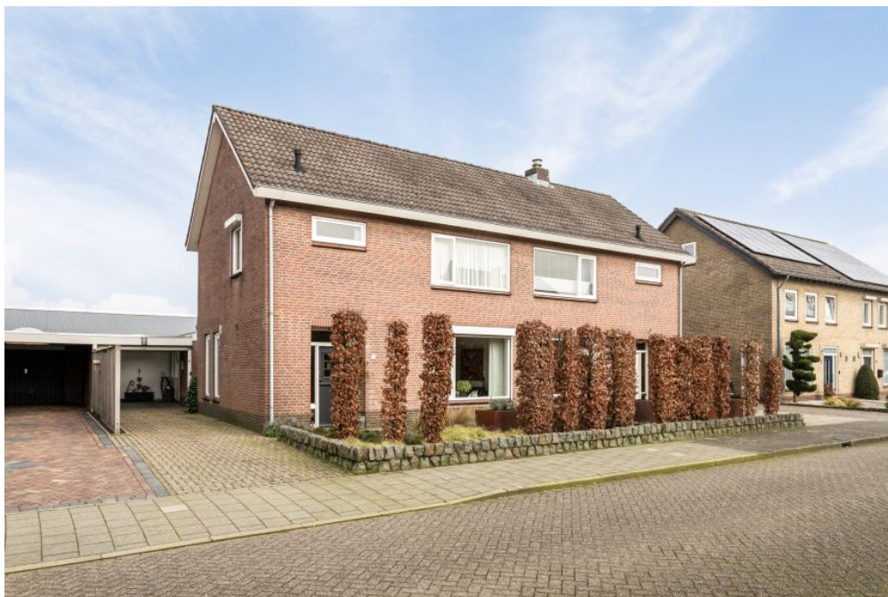
Acacialaan 5453 KB Langenboom 19 Vraagprijs: op aanvraag.k.