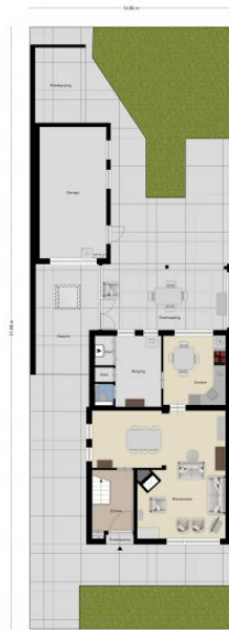
Aan de plattegronden kunnen geen rechten worden ontleend