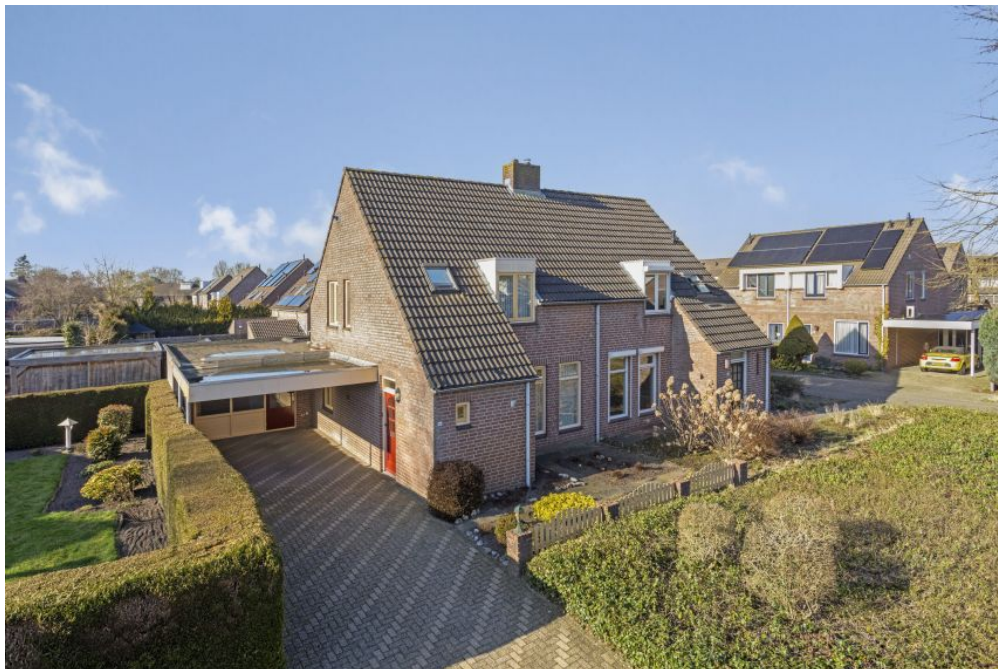
Vlaskam 5446 WV Wanroij 16 Vraagprijs: op aanvraag.k.