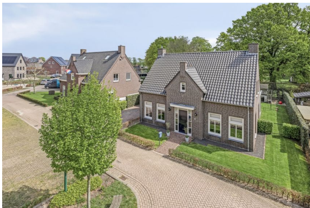
Den Eik 5843 AZ Westerbeek 16 Vraagprijs: op aanvraag.k.